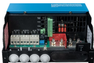
Zone de connexion 12/3000/120-50