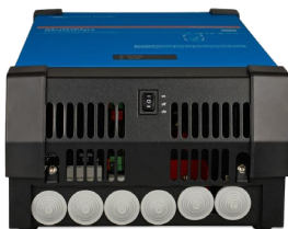
MultiPlus 2 000 VA (avec couvercle inférieur)