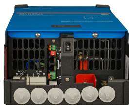
MultiPlus 2 000 VA (sans couvercle inférieur)